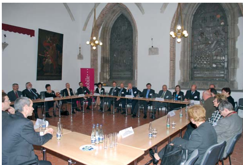
Setkání profesních komor se uskutečnilo v Brně v gotických prostorách Kapitulní síně Augustiniánského opatství.